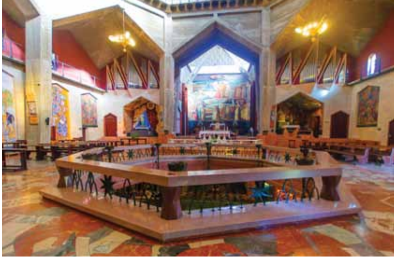
Basilica de la Anunciacion en Nazaret

Isram Israel, se une con otros reconocidos operadores de paquetes turísticos, para brindarles la oportunidad de "hacer su sueño una realidad," al llevarle en este recorrido espiritual a Tierra Santa, donde podrá visitar los lugares de los cuales hemos leído en la Sagrada Biblia, caminando al caminar por los lugares que EL Caminó, rezar en los lugares en los cuales EL perdicó, una completa paz y tranquilidad interna. No hay otro lugar como la Tierra Santa para reviver los eventos de la vida de Jesús, y poder experimentar en esta visita a los lugares santos de Israel, cómo cuerpo y alma se unen en un solo ser con Dios, cambiando nuestra vida para siempre.