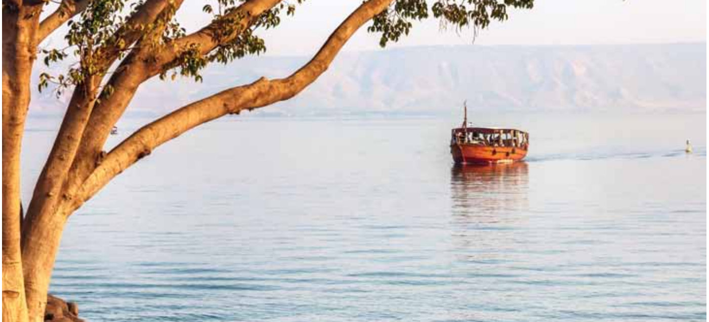
Sea of Galilee

Por ultimo una breve visita a la Fabrica de Diamantes, segunda industria mas importante del pais. Cena y alojamiento en Kibbutz Hotel de Tiberiades. (D.C.)