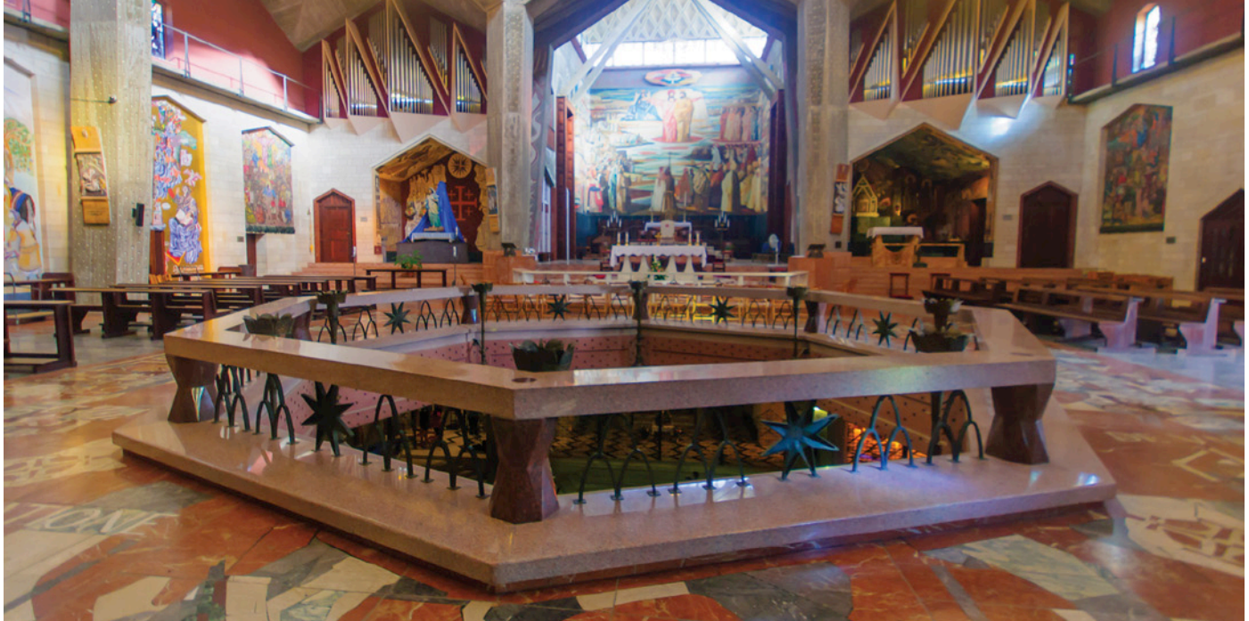
Basilica de la Anunciación en Nazaret

Por ultimo una breve visita a la Fabrica de Diamantes, segunda industria mas importante del pais. Cena y alojamiento en Kibbutz Hotel de Tiberiades. (D.C.)