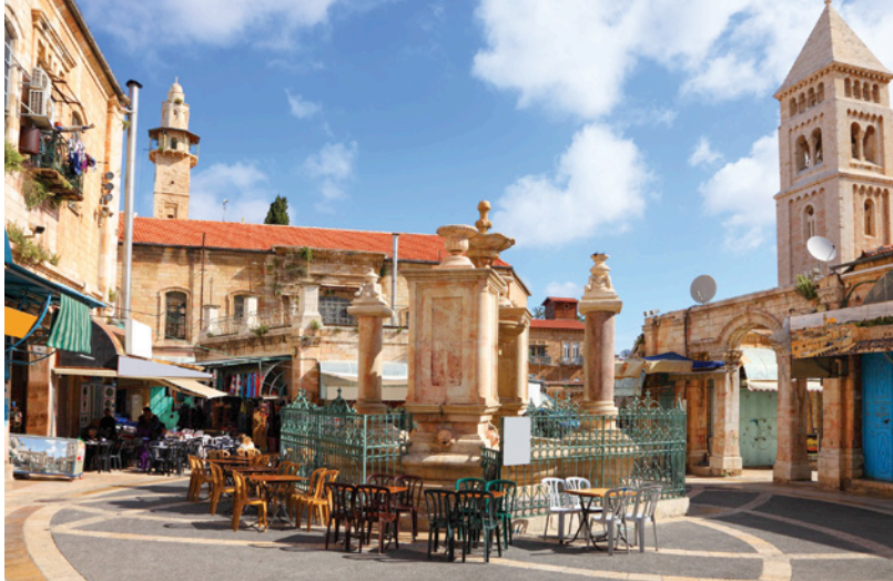
Café en el barrio Cristiano en la Ciudad Vieja de Jerusalén

Isram Israel, se une con otros reconocidos operadores de paquetes turísticos, para brindarles la oportunidad de "hacer su sueño una realidad," al llevarle en este recorrido espiritual a Tierra Santa, donde podrá visitar los lugares de los cuales hemos leído en la Sagrada Biblia, caminando al caminar por los lugares que EL Caminó, rezar en los lugares en los cuales EL perdicó, una completa paz y tranquilidad interna. No hay otro lugar como la Tierra Santa para reviver los eventos de la vida de Jesús, y poder experimentar en esta visita a los lugares santos de Israel, cómo cuerpo y alma se unen en un solo ser con Dios, cambiando nuestra vida para siempre.