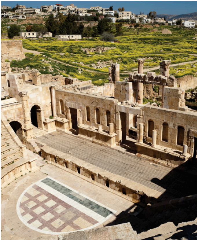
Teatro Antiguo en Jerash

Impuesto a frontera no incluido (approx. $50 por persona)